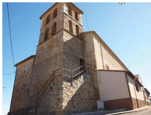
▪ Fig. 8. Vista exterior del baptisterio, torre y soportal lateral de la iglesia de San Miguel de Cubillas de Rueda.

año 1998 con las labores de levantado y nuevo entablado de la cubierta y tejado, junto a la sustitución de las ventanas y pavimentos interiores (Fig. 8) 79 .