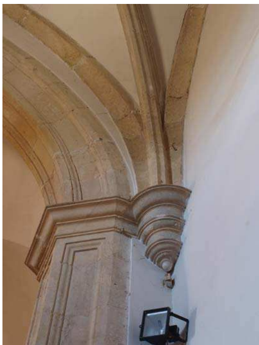
▪ Fig. 4. Detalle de una de las mesetas semicirculares sobre ménsula en el abovedamiento interior de la capilla mayor de la iglesia de San Miguel de Cubillas de Rueda.

maderos traídos desde la cercana localidad de Quintana del Monte, junto a clavos, clavijas y un pago por valor de ciento cincuenta y tres reales empleados en los cuarenta y tres jornales necesarios para el retejo y caedizo de la iglesia 39 .