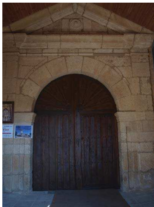
▪ Fig. 6. Portada de la iglesia de San Miguel de Cubillas de Rueda.

A estos momentos pertenece la construcción de la portada principal de la iglesia; de corte clasicista, presenta una disposición a base de un arco de medio punto entre pilastras y remate de frontón triangular en cuyo tímpano se dispone una roseta (Fig. 6) 66 .