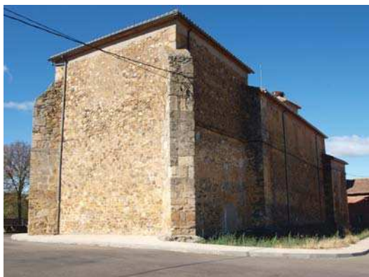
▪ Fig. 3. Vista exterior de la capilla mayor de la iglesia de San Miguel de Cubillas de Rueda.