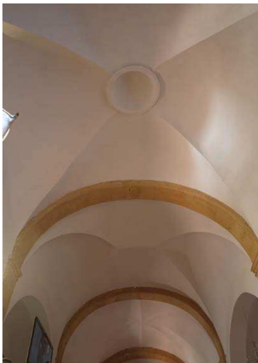
▪ Fig. 5. Abovedamiento de la nave de la iglesia de San Miguel de Cubillas de Rueda.