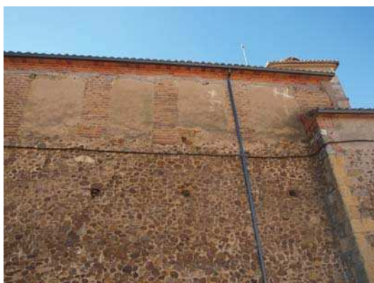
▪ Fig. 7. Detalle del muro exterior norte en el que sobre el muro de mampostería se aprecian los pilares de ladrillo y rellenos de adobes. Iglesia de San Miguel de Cubillas de Rueda.

Tras esta ampliación, el nivel de altura de la nave se equiparaba al de la torre, por lo que se opta por hacerla más alta, levantándose entre 1792 y 1793 un doble cuerpo de campanas y aprovechándose para construir un soportal en el lado sur del templo 72 .