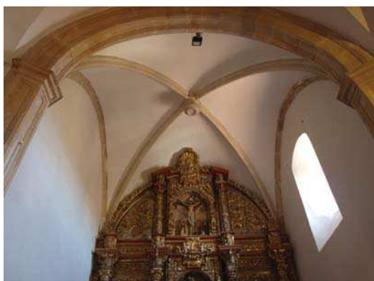
▪ Fig. 2. Vista interior de la bóveda de crucería y arco de apertura de la capilla mayor de la iglesia de San Miguel de Cubillas de Rueda.

los años siguientes figuran nuevos pagos a Lezica que se encontraría cubriendo la capilla mayor, tal y como se deduce del hecho de que se destinen “veinte y ocho maravedís de vino con que combidar a los que ayudaron a subir la clave de la capilla” y “de haçer los andamios para armar los cruçeros para la capilla y arcos cinco reales y medio” (Fig. 2) 27 .